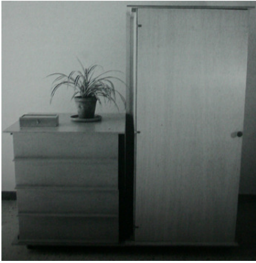
Img_6. Serie de muebles componibles para ser montados por usted mismo. (1974)

Con este proyecto planteaba una declaración de intenciones para que el mobiliario se pudiera producir de forma seriada y fuera distribuido de forma masiva, teniendo en cuenta cada una de las fases. Dentro de su carpeta de apuntes y diseño del sistema, contempla aspectos como el sentido pedagógico de la autoinstalación, la facilidad de transporte del sistema descompuesto, e incluso la incorporación de un embalaje reutilizable.