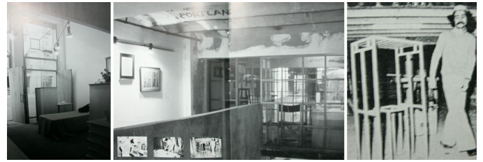
Img_5. Botiga Estudi Taller del carrer Diputació.

Formado en Eina, escuela de diseño y muy consciente del valor, los procesos, el contacto y conocimiento de los materiales, colaboró en un taller de ebanistería, formación que le ayudará a entender los materiales en todos los procesos del diseño y a abrir el 1973, el Estudi Botiga Taller de la calle diputación. Espacio donde realizó la serie de mobiliario que marcó un punto de inflexión en su carrera y en su nueva manera de entender el diseño.