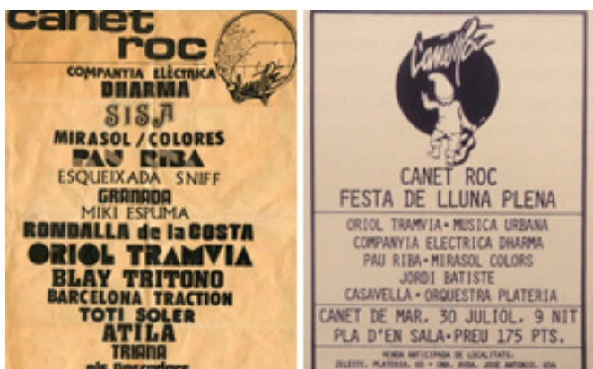
Img_9. Cateles del festival Canet Rock / Fotografia de Jaume Sisa y Pau Riba.

Uno de los eventos sociales donde las propuestas de alternativa cultural tuvieron cabida y aceptación fue el festival de Canet Rock 1975 en Canet de Mar.