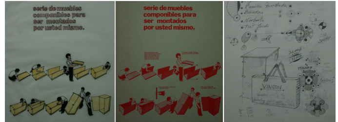
Img_7. Instrucciones de montaje. Diseño gráfico de América Sanchez./ Diseño del embalaje del sistema reutilizable.

instrucciones de montaje. Un sistema que el mismo proyectó, fabricó y distribuyó desde la Botiga Estudi Taller de la calle Diputació.