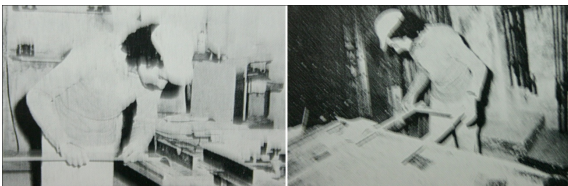
Img_11. Carles Riart, en la "Botiga, Estudi Taller" de la calle Diputació.

El paso de un diseño industrial y seriado, al proyecto personalizado y trabajado de forma artesanal, mediante proveedores cercanos con un alto grado y capacidad de entender los requerimientos de diseño. El planteamiento de una edición local que determina únicamente los recursos imprescindibles para crear mobiliario de larga durabilidad tanto estética como cualitativa.