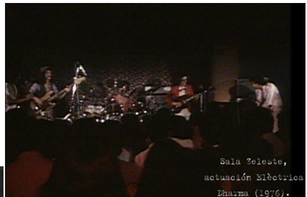
Img_3. Sala Zeleste

Referentes, sobretodo musicales, que se empezaron a oír en ciertos bares y fiestas barcelonesas. La Sala Zeleste en la calle Platería se convertiría en el local de la alternativa cultural barcelonesa, y otros como, el Café de la Opera en la Rambla 74 o el London situado en la calle Nou de la Rambla, el ya establecido Boccaccio a finales de los 60 con la “Gauche Divine”, con un ambiente más clasista y muchos otros.