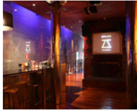
Img_14. Zsa-Zsa music