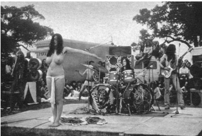
Img_2. Fotografía de la actuación del grupo Hawkwind en el Isle of Wight festival 1970.

Esa necesidad venía marcada por dos aspectos principales, una, la previsión de la decadencia de un régimen y el resurgimiento de una nueva etapa que sería la transición, y el otro aspecto fundamental era que el país se vería inmerso en una gran crisis económica mundial, la llamada crisis del petróleo del 73. Estos dos aspectos de represión sociocultural y económica fueron la base de incitación a este nuevo resurgir, pero esa explosión requería referentes, referentes estadounidenses provenientes de los marines que se dirigían a Ibiza y de las grandes influencias de los movimientos londinenses. Bob Dylan, el festival de la Isla de Wight 1970 en el Reino Unido y los Hippies, marcaron la tendencia de relación del movimiento contracultural.