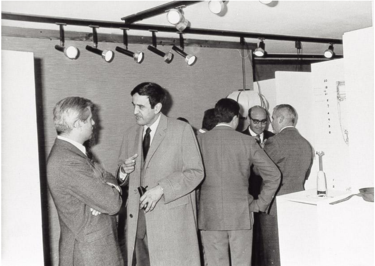
Fig. 2. Tomás Maldonado conversando con André Ricard en la exposición “Diseño industrial en España” presentada en el Colegio de Arquitectos de Valencia (1967).

que rompían con el discurso esteticista predominante en aquellos momentos en nuestro país.