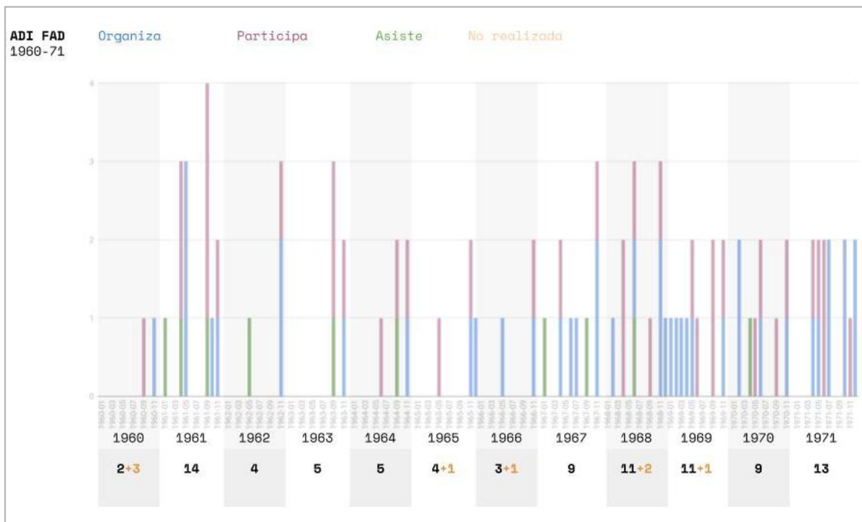
Fig. 5. El gráfico muestra, mes a mes, las actividades que ADI/FAD organizó, en las que participó o a las que asistió entre 1960 y 1971.

La Asamblea tuvo lugar los días 11 y 12 de octubre en la sala de actos de la Escuela Elisava en Barcelona y el Congreso del 14 al 16 en la Cala San Miguel de Ibiza. El “diseño” de un encuentro en un contexto distendido, que huía de los parámetros habituales de este tipo de eventos y que abogó por su construcción a partir de los intereses y propuestas de los propios participantes, colocó a ADI/FAD en el foco de la opinión pública internacional y abrió un nuevo capítulo en su historia dejando atrás el gris y difícil franquismo.