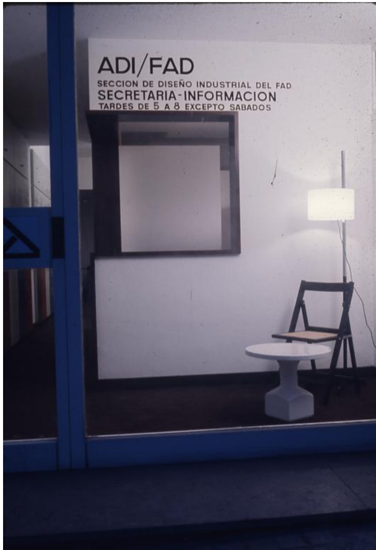
Fig. 3. Entrada del nuevo local de la calle Brusi, remodelado por Juli Schmid y Miguel Milá (1968). Museu del Disseny de Barcelona. Fondo ADI/FAD.

Si bien la asociación había concentrado su actividad en Barcelona, sus miembros mantenían contactos constantes con profesionales del resto de España. En las II Conversaciones sobre Diseño Industrial celebradas en Valencia, se formaron provisionalmente tres delegaciones en Madrid, Valencia y Córdoba, 18 quedando constituidas las dos primeras, mientras que la tercera no llegó a materializarse.