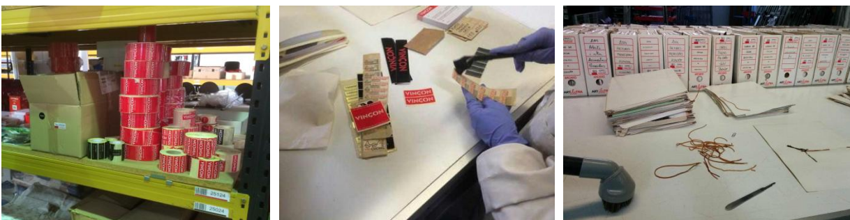
Procedimientos de conservación: selección de material, limpieza por aspiración y limpieza mecánica de documentos del archivo de Vinçon.

El respeto a estos procedimientos y concreciones es un requisito indispensable para la participación en estos sistemas, garantiza su adecuada conservación y disposición al servicio de la investigación, permite compartir datos y llegar a un mayor número de públicos. Además, sólo de esta forma se podrá conseguir que los diferentes elementos del sistema (documentos de diferentes archivos, material bibliográfico, catálogos comerciales, etc.) se relacionen correctamente y dialoguen entre sí y con los objetos de la colección del museo, permitiendo sacar a la luz nuevos datos e información al servicio de la investigación.