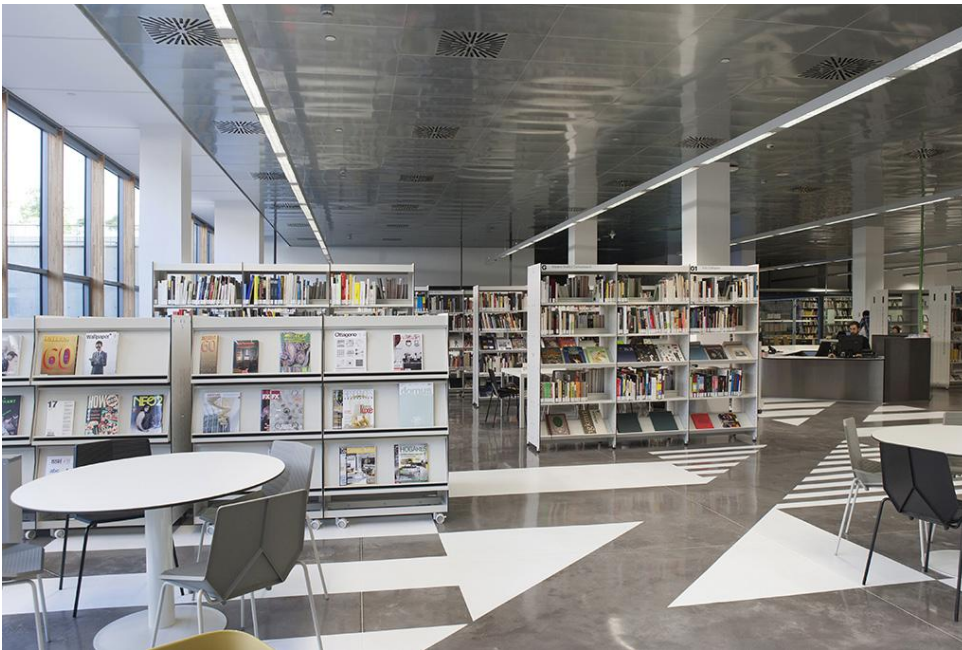
Sala de consulta del Centro de Documentación del Museu del Disseny.

Por tanto, se han diseñado unos espacios públicos de consulta (Díaz, 2014) de acceso libre y gratuito, con el objetivo de ser un punto de referencia para estudiantes, docentes y profesionales de todas las disciplinas del diseño, sin por ello cerrar las puertas a otros usos o intereses, ya sean profesionales o personales, incluyendo a los propios visitantes del museo y a una ciudadanía cada vez más formada que no siempre tiene acceso a archivos y bibliotecas universitarias o especializadas (Docampo, 2013, p.198).