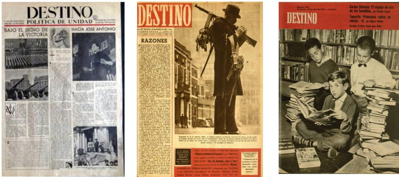
Figura 3. Varias portadas de la revista Destino .

El primer registro que hemos encontrado en Destino de la palabra diseño es de diciembre de 1957, de la mano, como no, de Oriol Bohigas al señalar las novedades del VII Salón del Hogar Moderno; “Y aquellos productos industriales que merezcan una especial atención desde el punto de vista de su diseño [...]”. En el texto también utilizó la expresión nuestros “designers” o “industrial designers”, para normalizarla posteriormente con la frase: “Y señala una indiscutible calidad en esta primera muestra de diseño industrial español” (La casa moderna en el F.A.D.). No obstante, aún costará que el uso del verbo diseñar sea ampliamente aceptado. Así, durante los siguientes dos años, en Destino aún se alternó la palabra diseño y los significados profesionales asociados, con la de decorador , o arte decorativo .