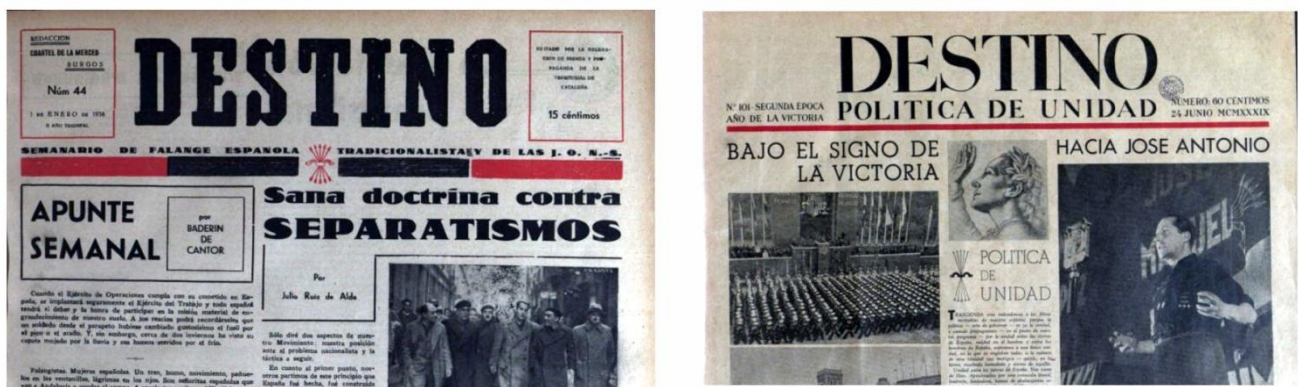
Figura 2. Revista Destino , nº 44, 1938 (Burgos) y nº 101, 1939 (Barcelona).

Cada semana las páginas de Destino ofrecían una información viva, que no se conseguía en otros medios y que conectaba con el pulso vibrante y en ebullición de la ciudad y del mundo.