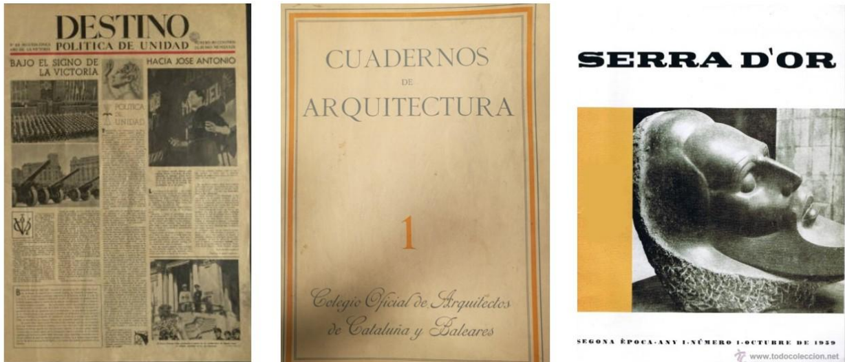
Figura 1. Revista Destino , nº 101 (el primero editado en Barcelona), 1939. Cuadernos de Arquitectura , nº 1, 1944. Serra d'Or , nº1, 1959.